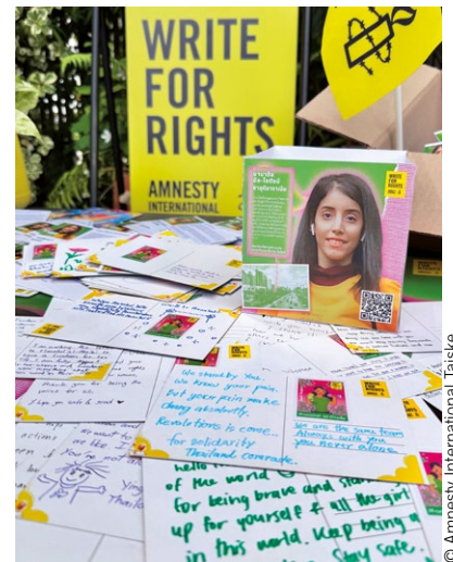
Peticije in razglednice v podporo Manahel Al-Otaibi, ki je bila del akcije Pišem za pravice 2024.

DOVOLJ PROSTORA za čustveno vključenost in razvoj lastnega mnenja.